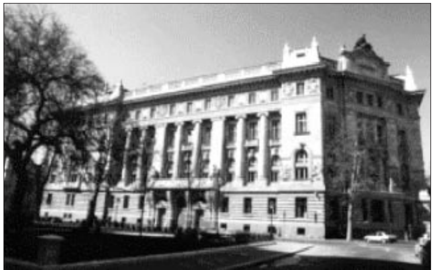
■ Az MNB műemlék épülete

A látogatóközpontoz tartozik egy könyvtár, valamint előadóterem, mind