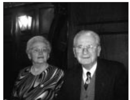
■ Az ünnepelt felesége társaságában