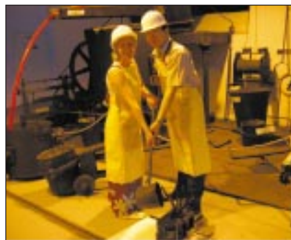
■ Fotó készül az öntömesterekről

Kezdetben a múzeumot ismerő baráti és szakmai körök képviselői jöttek, később aztán egyre nagyobb számban érkeztek a múzeummal ismerkedni szándékozó látogatók, azok, akik tudatosan fűzték fel múzeumunk megtekintését tervezett programjukba.