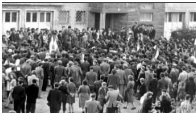
■ Nagygyűlés a lakótelepen a Casino előtt

Érdekes lenne, ha valaki, aki emlékszik az eseményekre, írna néhány sort szerkesztőségünknek.