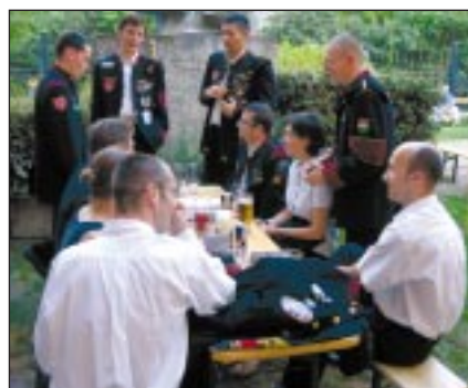
■ A fiatal kohászok alkalmi kórusa

gatók, azok, akik tudatosan fűzték fel múzeumunk megtekintését tervezett programjukba.