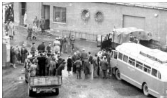
■ Vidéki agitációra mennek a munkások a gyár portája előtti térről