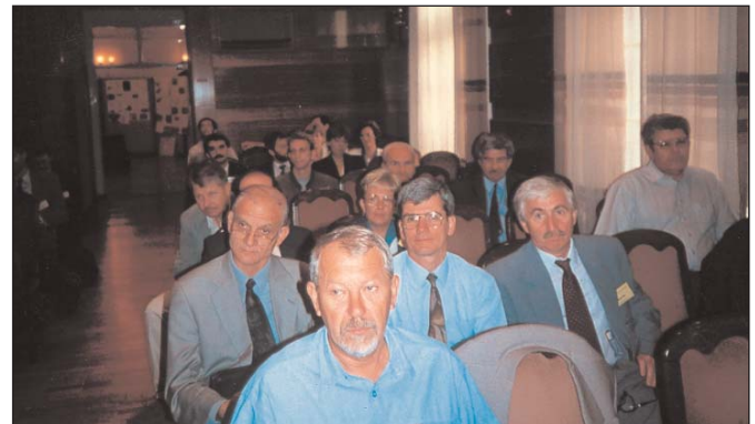
A vándorgyűlés hallgatóságának egy csoportja