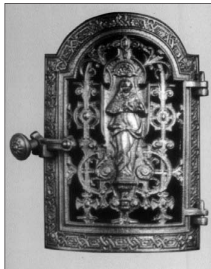
Kép: 1890. körül készített aninai öntöttvas kályha Szent Borbálát ábrázoló ajtaja.