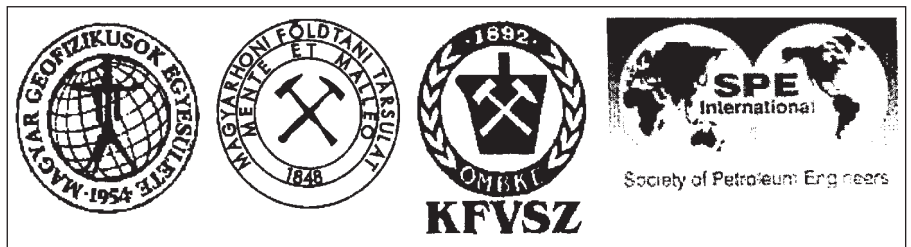
A négy rendező egyesület emblémája

A computer tomográf alkalmazási lehetőségei Triász karbonátos tárolók paramétereinek