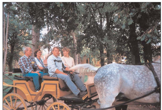
A szenttamási kastélypark körbekocsikázása