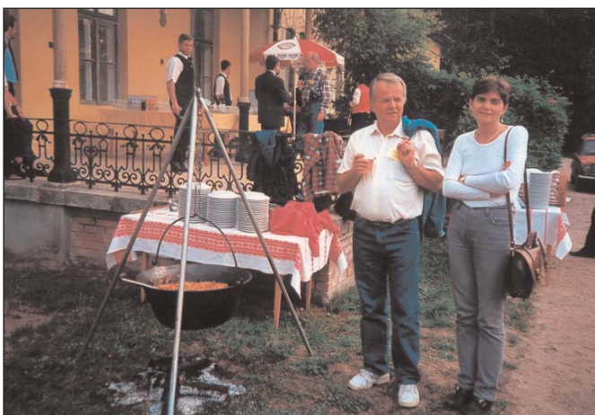
Elkészült a „slambuc” a szenttamási pikniken