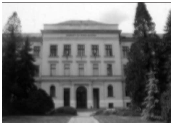
Az Alma -Mater

nisztériumának főosztályvezetője nyitotta meg, aki szlovák és magyar nyelvű ajánlójában hangsúlyozta a két ország közötti kulturális kapcsolat erősítésének fontosságát. (A kiállítást augusztus 21-ig lehetett megtekinteni). Délután a Polgármesteri Hivatalban találkoztak a bányász, kohász és erdész szakma által érintett önkormányzatok polgármesterei, az egykori Alma Mater (ma a Nyugat-Magyarországi Egyetem Erdőmérnöki Kara) területén tett közös séta keretében elültették a Botanikus kertben a találkozó emlékfáját, és megkoszorúzták Mikovinyi Sámuel emléktábláját. Este a rendezvény fő színhelyén, az egykori líceumi sportpályán (licista pálya) felállított központi nagy sátorban a Juventus Koncert Fúvós-zenekar adott műsort a III. Bányász–Kohász–Erdész Találkozó ünnepélyes megnyitójáig. Az ünnepély kezdetét kürtösök jelezték. A magyar himnusz után dr. Gimesi Szabolcs Sopron Megyei Jogú Város pol-