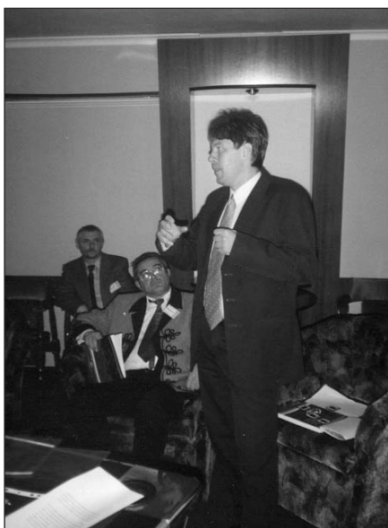
3. kép. A bányászat szekció egyik előadása

vevő megkapta. Végre megjelentek a romániai magyar kőolaj- és földgázbányászok is (SCHELA PETROL, Arad), szakosztályunk azonnal felvette a kapcsolatot velük.