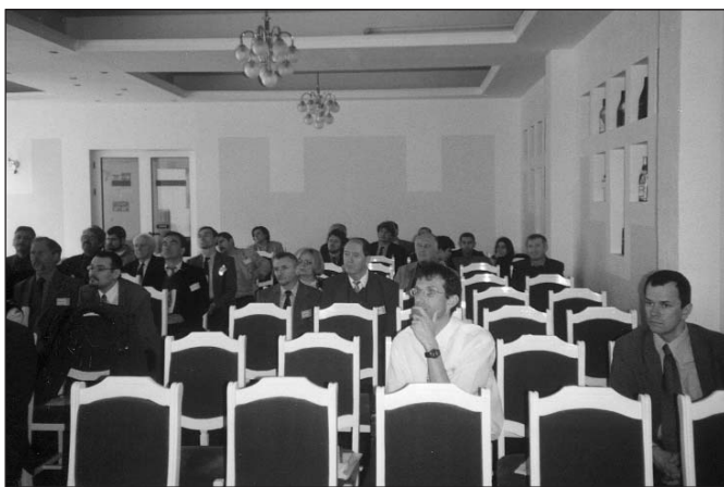
2. kép. A plenáris előadás résztvevői