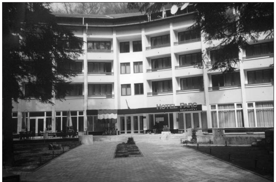
1. kép. A konferencia helyszíne: Menyháza, Park Szálló

A találkozó programját, az előadások kivonatait, a résztvevők listáját és Czárán Gyula rövid életrajzát megjelentette az EMT, ezeket minden rész-