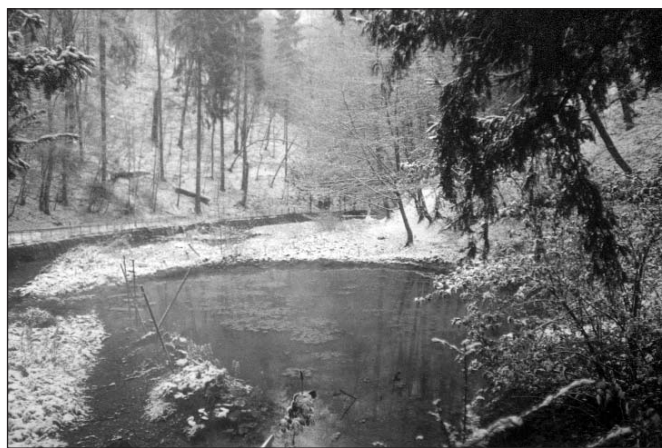
4. kép. Hévízforrás a fürdők-völgyében