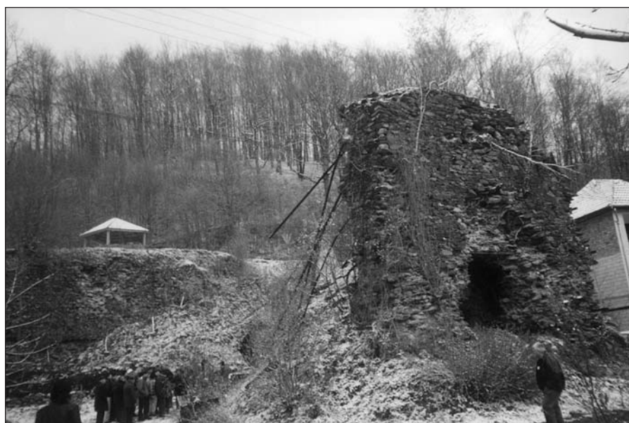
5. kép. Wenckheim-féle vashámor

7. megálló: Dézna vára (7. kép). A várhoz felmenet permkori enyhén át-