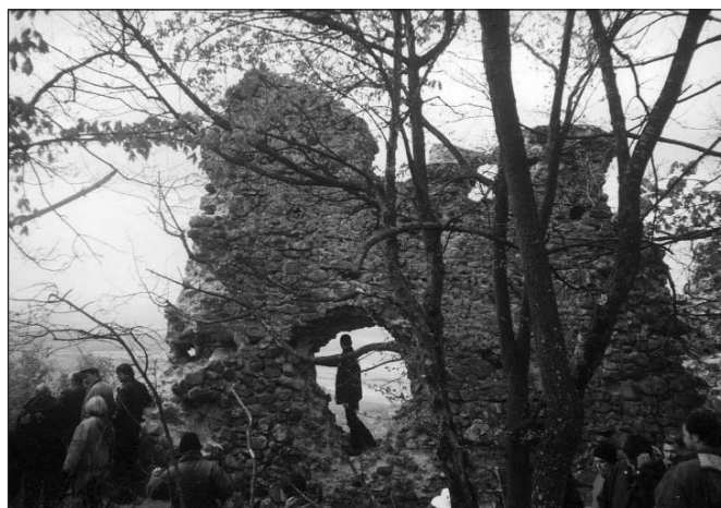
7. kép. Dézna vára

alakult üledékekkel, majd a vidékre oly jellemző szarmatakori andezit-agglomerátumokkal találkoztunk. A vár valószínűleg Árpád-kori, de az első említése 1318-ból való. A török időkben igen fontos végvári szerepe volt. A múlt században még élő legenda szerint önmagukat feláldozó magyar rab leányok robbantották fel. Ezt – egy kissé átszínezve, fellazítva – Kurbán bég című novellájában Jókai Mór dolgozta fel. Ugyanis Jókai Mór második erdélyi útja alkalmából több napot töltött Dézsnán Török Gábor reformkori vármegye-alispán, helyi birtokos (ma is meglévő, de átalakított) kúriájában, és itt (bizonyára) Menyházát is bejárva, tanult meg lovagolni. Lóháton járhatott a várban is. Az úton a Béli-hegység két növénytani ritkaságával találkozhatunk: a szürös csodabogyóval, amely Erdélyben alig néhány, így Félix-fürdőtől Dézsnáig 5-6 helyen (és Bélbor mellett) fordul elő, valamint a fehérvirágú kakasmandikóval, amely Erdélyben kizárólag a Béli-hegységben és Kisdisznónodon található.