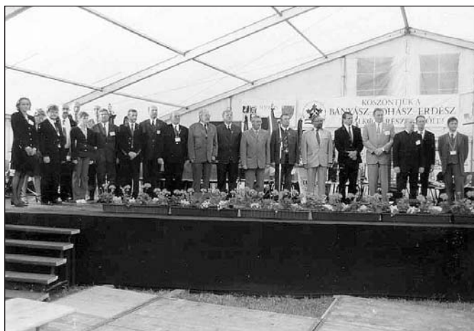
A megnyitó ünnepség elnöksége

A találkozóra érkezett zenekarok, tánc- és majorettescsoportok a szombati és vasárnapi fúvószenekari fesztivál műsoraiban mutatkozhattak be. A városi helyszíneken és a fősátorban 17 zenei együttes (fúvós- és jazz-zenekar, harang-együttes, ütösök) valamint 8 tánc-, illetve majorettescsoport és énekkar szórakoztatta a város lakóit és a találkozóra érkezőket. Sajnos, a zsúfolt program és a nagy távolság miatt a fősátorban délelőtt fellépő együttesek műsorának igen kevés számú nézőközönsége volt. (Külön említésre méltó a soproni Petőfi Sándor Általános Iskola és a városi zeneiskola nő-