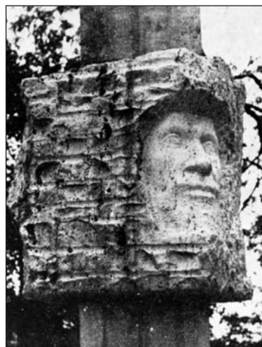
4. kép. Zsigmondy-szobor a harkányi sétányon

Az e szoborról készült másolatot találjuk Nagykanizsán, a Zsigmondy Vilmos Kőolajbányászati és Mélyfúróipari Szakközépiskolában.