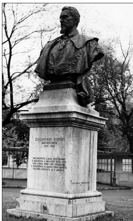
1. kép. Zsigmondy Vilmos mellszobra a Városligetben

A Fővárosi Tanács 1895. szeptember 25-i közgyűlési határozata szerint „Szécsi készíti el Zsigmondy szobrát”. A Képzőművészeti Tanács által megbízott Szécsi Antal az életnagyságúnál jóval nagyobb (1,5 m-es), bányászöltözetben, jobbra néző mellszobrot készített el. A bronz mellszobor egyszerű haraszi mészkő talpazaton állt az akkor Artézi fürdő egyik sarkában. Később a szobrot az új, Széchenyi fürdő