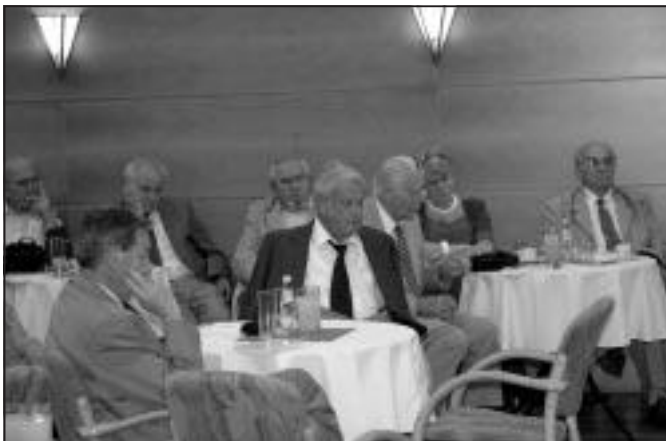
3. kép: A bemutató hallgatósága

Az ünnepség kapcsán adódott a lehetőség, hogy a riportokban megszólalt, de a könyv megjelenésekor már el-