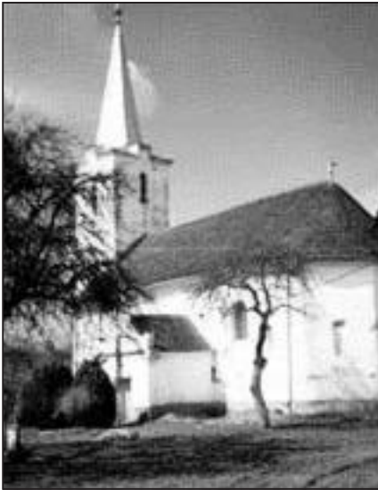
5. kép: Magyarremete, református műemlék templom

viszonylag jó állapotban vannak, megmentésükért érdemes áldozni.