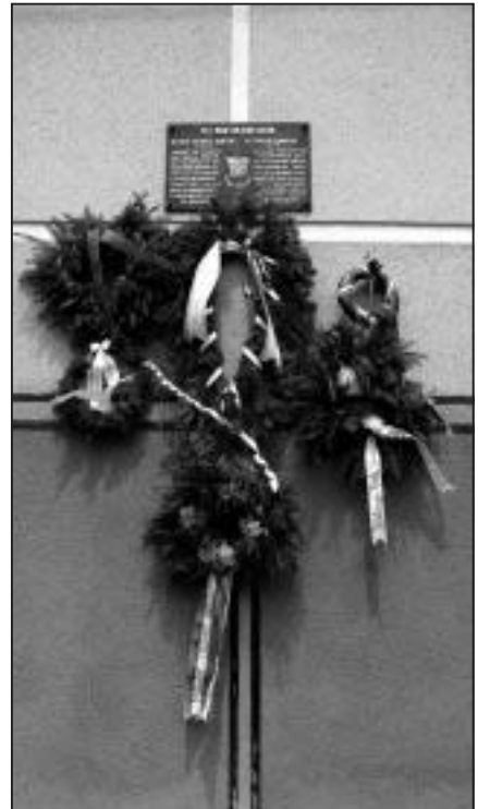
3. kép: „Born–Papp”-emléktábla