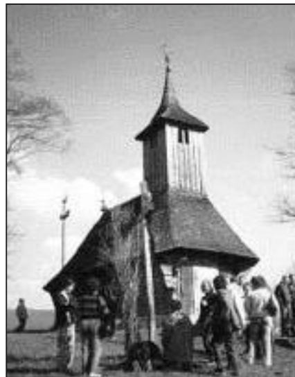
6. kép: Kapocsány, Ortodox műemlék templom

Körösmart körül a bádai és a pannóniai üledékek vannak nagy elterjedésben a felszínen, amelyeket a dombok tetején pleisztocén képződmények fednek. Itt a kutatók a pannóniai rétegek gazdag kövülettartalmú szintjeit