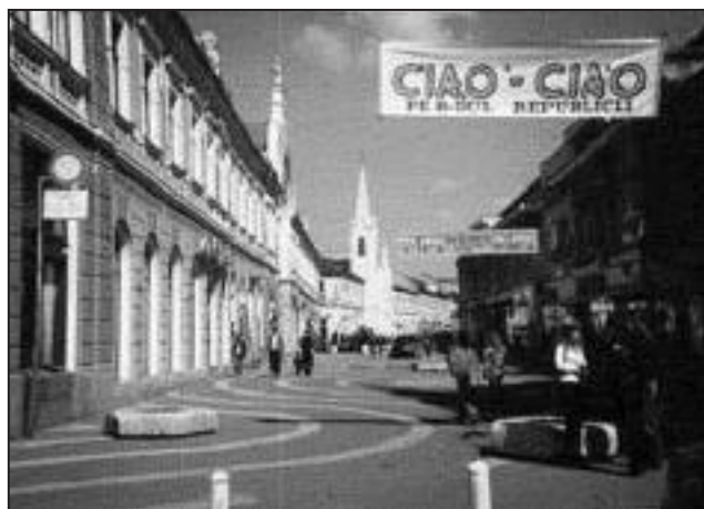
2. kép: Nagyvárad, Köztársaság utca