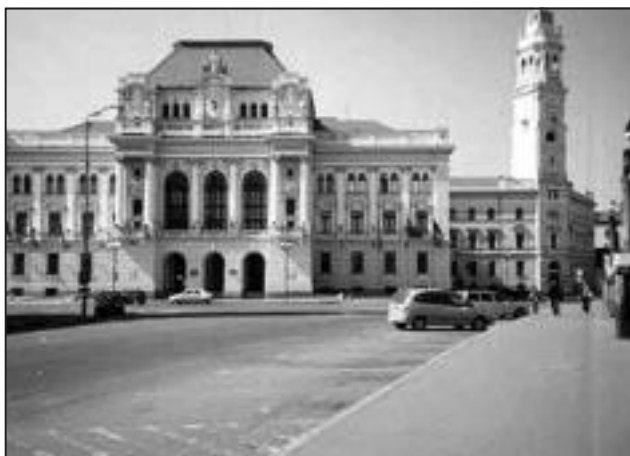
1. kép: Nagyvárad, Városháza

A konferenciának a városban a Partiumi Keresztény Egyetem termei adtak helyet, a résztvevők jól érezték magukat, sok új információval gazdagodtak, szakmai és baráti kapcsolatok szövődtek. A résztvevők plenáris és szekció előadásokat hallgattak és egynapos szakmai és kultúrtörténeti kiránduláson vettek részt.