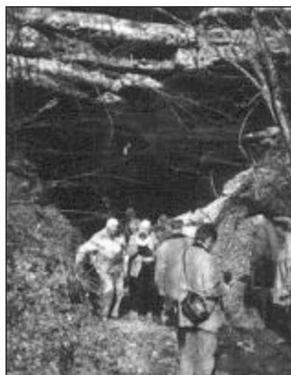
3. kép: A Tasádfői barlang bejárata

Az Albioarei-szoros és környéke nemcsak látványos karsztmorfológiájával tűnik ki, de a mészkőképződmények kőületegazdagsága és a bauxitlencsék (mára már lecsengett) gazdasági értéke is felhívta magára a figyelmet.