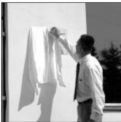
1. kép: A MOL Rt. főtámogatói tábla leplezése