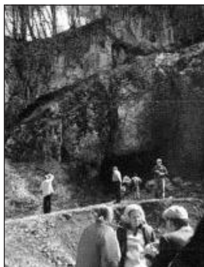
4. kép: A bauxitbánya maradványai

A területen a karszt mélyedéseibe lerakódott bauxitoknak 3 fajtája ismert: egy vörös színű, magas Al-tartalmú, egy szürke és egy sárgás, agyagásványokban feldúsult. Ma már csak emlékei találhatók meg a helyszínen az egykori bauxitbányászatnak. (4. kép)