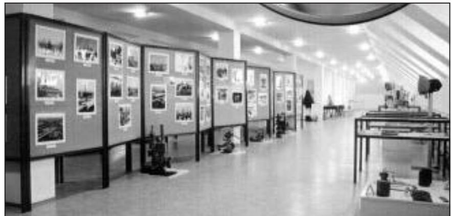
2. kép: A kiállítás részlete

A magyar kőolaj- és földgázszállítási iparág szakmatörténeti dokumentumainak és emlékeinek gyűjtése az 1970-es évek elejétől kezdődően folyik. A gyűjtemény a MOL Földgázszállító Rt. Vecsési Távvezeték Üzemének főépületében kapott helyet. A jelesebb emlékeket bemutató „Kőolaj- és földgázszállítás műszaki emlékei” c. kiállítás ünnepélyes megnyitója 1995. június 9-én volt (1. kép). Az avató be-