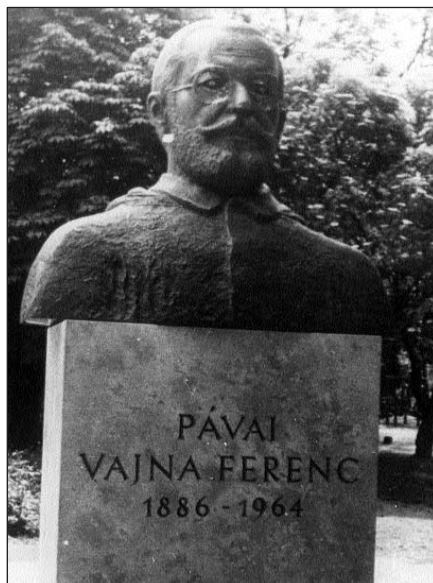
2. sz. kép.