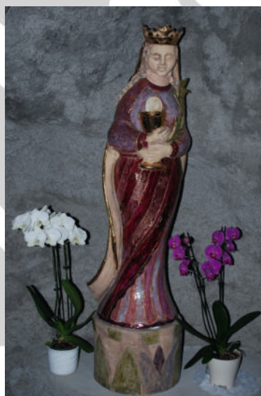
/Szent Borbála – Sziklateplom/