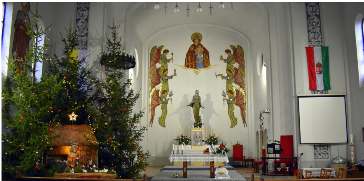
/Komlói Római Katolikus templom/